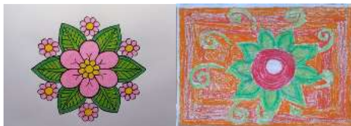
Gambar 3. Gambar Guru

Data pada grafik menunjukkan kreativitas siswa antarsiklus meningkat dengan signifikan. Hasil observasi pada siklus I sebesar 69,91% meningkat menjadi 78,59% pada siklus II, dan meningkat menjadi 88,43% pada siklus III. Peningkatan kreativitas siswa antarsiklus didukung dengan hasil belajar dan hasil karya siswa. Hasil belajar dan hasil karya siswa selama pembelajaran antarsiklus mengalami peningkatan. Peningkatan kreativitas siswa berbanding lurus dengan peningkatan aktivitas penerapan model Contextual Teaching and Learning (CTL) terhadap guru dan siswa pada setiap siklus. Hal ini selaras dengan pendapat Singkey, dkk. (2021) yang menyebutkan bahwa jika model Contextual Teaching and Learning (CTL) diterapkan, maka dapat meningkatkan kreativitas siswa. Peningkatan kreativitas dibuktikan dengan semakin lancarnya siswa dalam menuangkan ide gambar, mengeksplor warna dan bentuk, menghasilkan gambar yang unik, dan memerinci gambar secara detail dan rapi. Dapat dilihat pada gambar 3 dan 4.